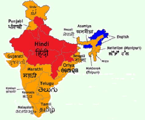
ที่มา : Ministry of Minority Affairs, Government of India